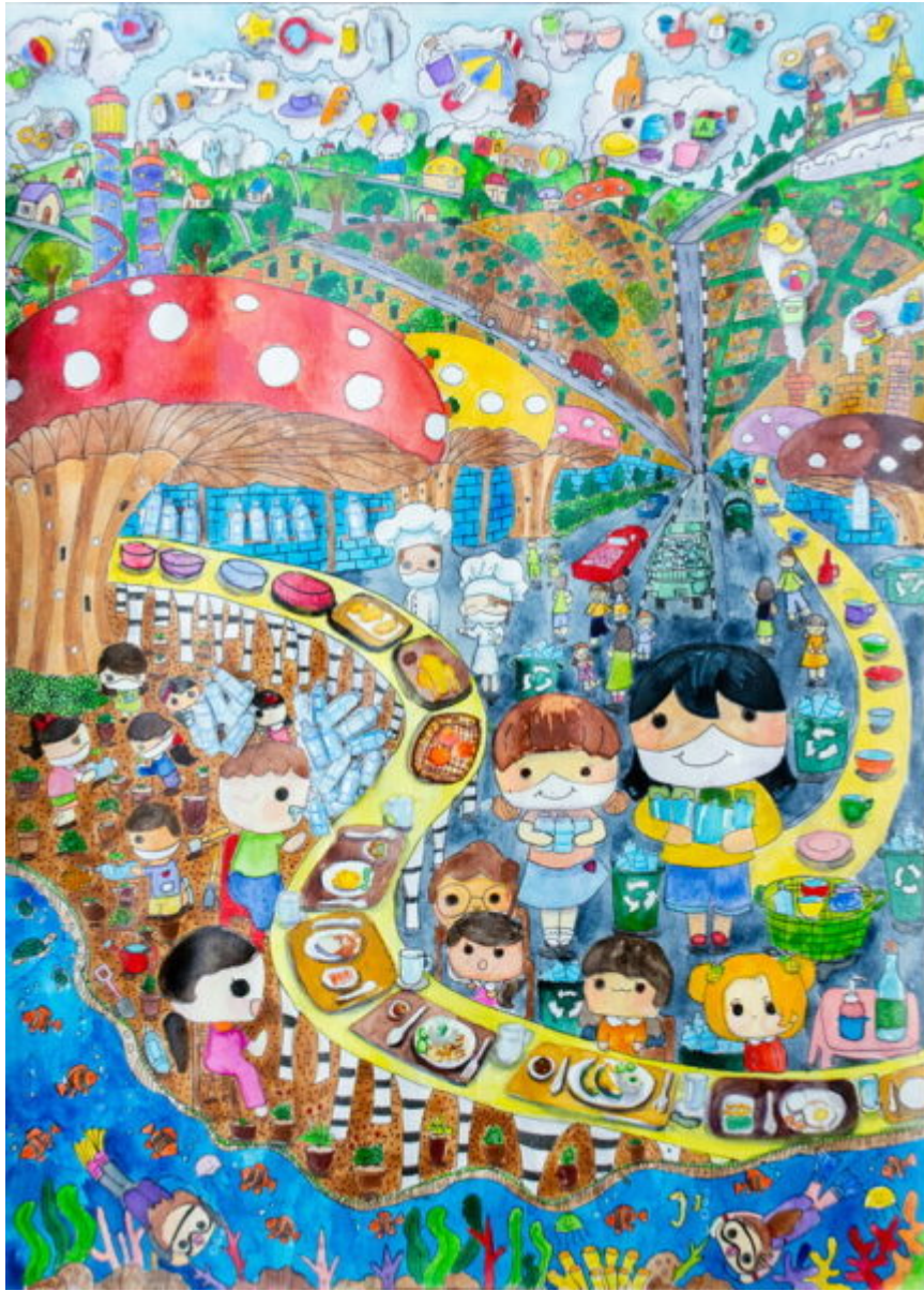
• ด.ญ.ณัชชา ณ ลำพูน