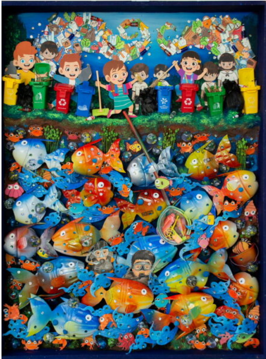
• น.ส.ทีฉิมพร ขวัญเนตร