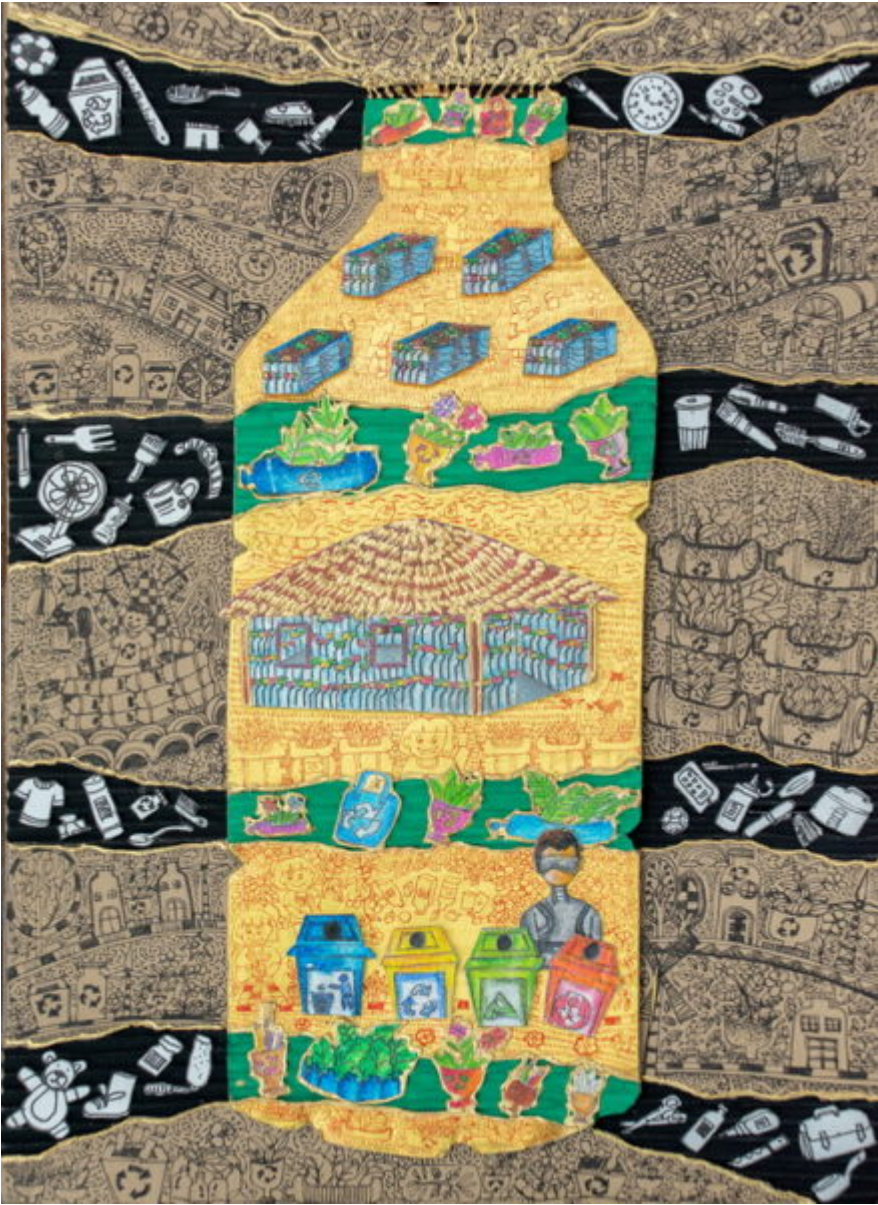
• ด.ญ.นุญญิตา จ้วแฉ่มีเส