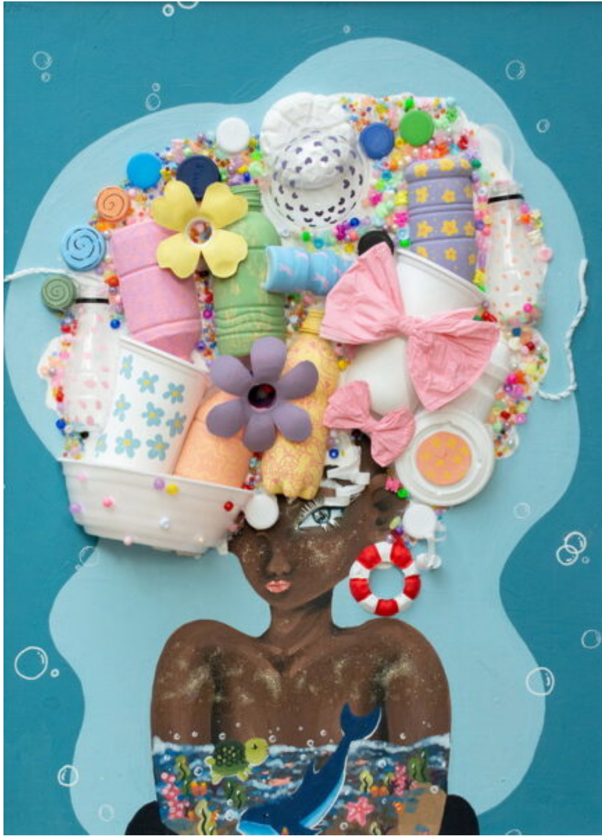
• น.ส.จณิสตา ลิ้มประเสริฐ